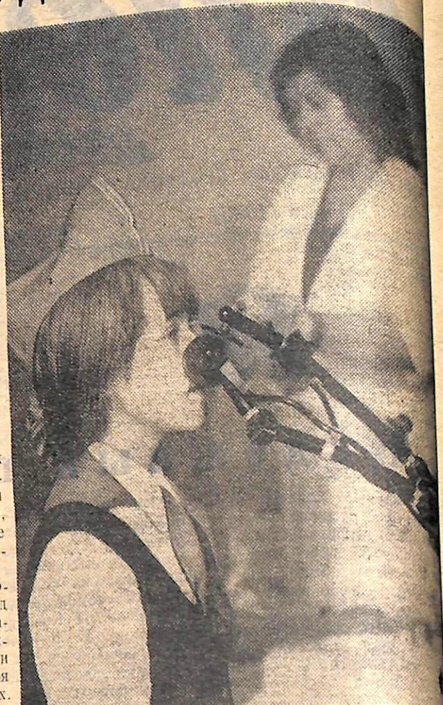
занимаются в кружках и секциях, участвуют художественной самодеятельности. Старшие ребята шефствуют над младшими.

Мы лечим детей, которые состояли на диспансерном учете, т.е. перенесших несколько раз в год простудные заболевания, нуждающихся в санации носоглотки, зубов, с нарушением осанки, физически ослабленных, с заболеваниями печени и желудочно-кишечного тракта, т.е. нуждающихся в оздоровительных и лечебных мероприятиях. Так, за сезон 1976 года отдохнуло 986 детей, из них 50 процентов находились на диспансерном учете и получили соответствующее лечение. Зубным врачом пролечено 70 процентов детей. В первую смену 1976 года отдыхает 350 детей из них 75 процентов — диспансерных. Для их оздоровления используются все имеющиеся у нас возможности. Дети, не имеющие противопоказаний, с разрешения врача принимают водные процедуры, участвуют в олимпийских спартакиадах, межлагерных соревнованиях, в походах и военных играх.